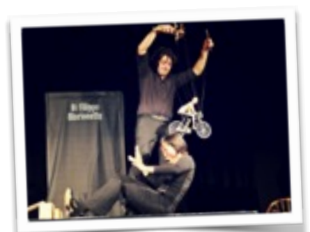
Festival In Fonte Veritas, Florence Italia, Aprile 2018