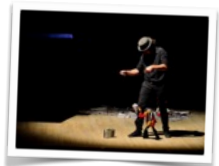
Festival Internacional de Marionetas de Patagonia Argentina, Sett 2014