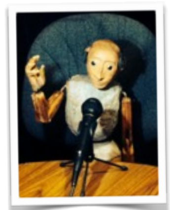
Gino on Radio Fremantle Australia Nov 2014