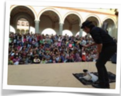
STRA Festival, Milan Italia, Settembre 2015