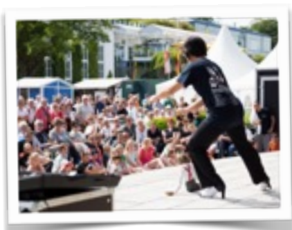
Kleinkunstfestival, Usedom Germania, Giugno 2017