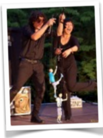
Kleinesfest Bad Pyrmont Germania, Agosto 2018