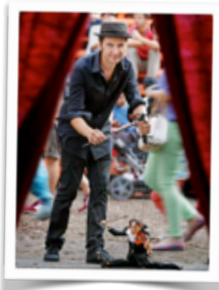
Schaubudensommer Festival Dresden Germania, Luglio 2014