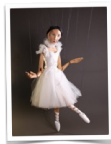
Pina la Bailarina