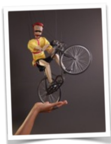
Costante il ciclista