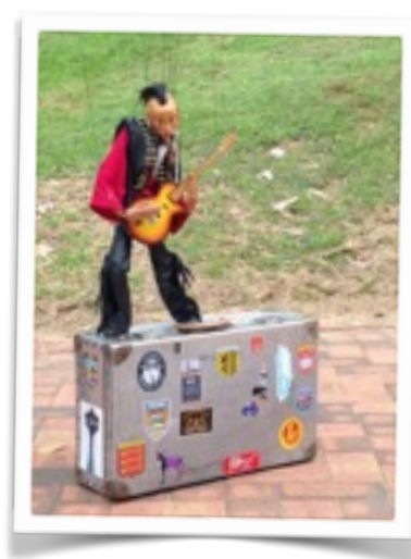
Johnny B. Good