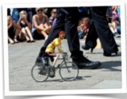
Festival Onderstroom, Vlissingen Olanda, Luglio 2016