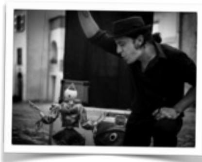
Artisti in Piazza, Pennabilli Italia, Giugno 2014